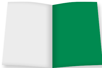
1/1 Seite: U 3 Umschlagseite B 210 mm x H 280 mm