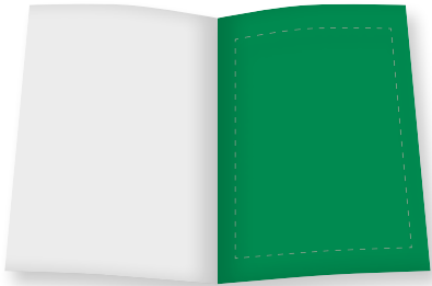
1/1 Seite B 210 mm x H 297 mm