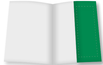
1/2 S. (hoch): Inhalt, U 2 und U 3 B 105 mm x H 297 mm