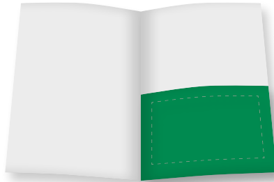
1/2 S. (quer): Inhalt, U 2 und U 3 B 210 mm x H 148 mm