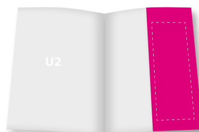
1 / 2 Seite (hoch)