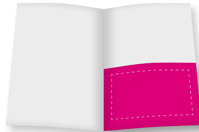
1 / 2 Seite (quer)