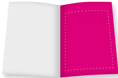
1 / 1 Seite