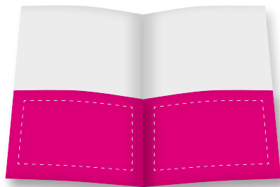
Panorama: 2 x (1 / 2 Seite (quer))