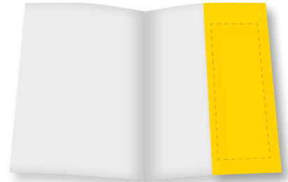
1 / 2 Seite (hoch) B 102 mm x H 280 mm