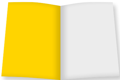
U 2 Umschlagseite B 210 mm x H 280 mm