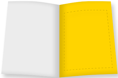
1 / 1 Seite B 210 mm x H 280 mm