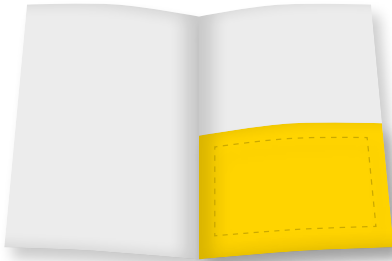
1 / 2 Seite (quer) B 210 mm x H x 140 mm