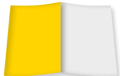
U 4 Umschlagseite B 210 mm x H 280 mm