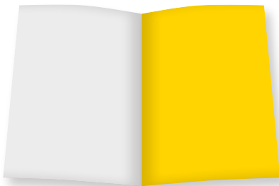
U 3 Umschlagseite B 210 mm x H 280 mm